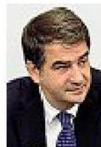
Il ministro per gli Affari europei, Raffaele Fitto. La Corte dei Conti: 72,8 miliardi ai territori

Per la Commissione una proroga per valutare lo stato dei lavori non è anomalia