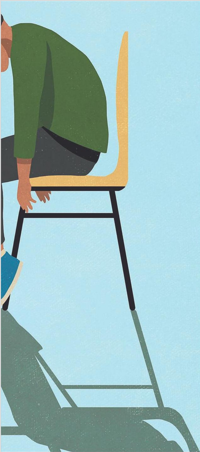
ILLUSTRAZIONE DI MALTE MUELLER - GETTY IMAGES/PSTOI

La proprietà intellettuale è riconducibile alla fonte specificata in testa alla pagina. Il ritaglio stampa è da intendersi per uso privato