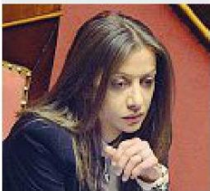
Mariarosaria Rossi , 49 anni, senatrice, eletta con FI, è passata nel Misto con gli Europeisti, quindi Cambiamo e ora in Coraggio Italia