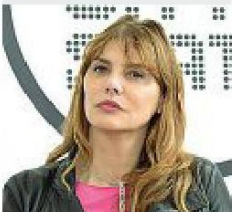
Maria Teresa Baldini , 60 anni, deputata eletta con Fratelli d'Italia, ha fatto un rapido passaggio al Misto, quindi in FI e ora in Coraggio Italia

La proprietà intellettuale è riconducibile alla fonte specificata in testa alla pagina. Il ritaglio stampa è da intendersi per uso privato