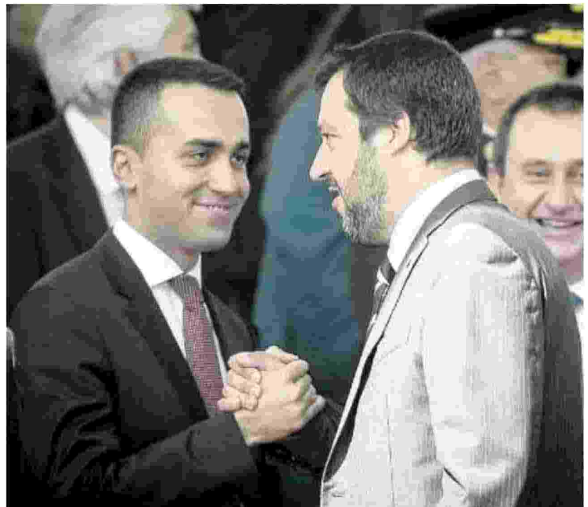
Luigi Di Maio e Matteo Salvini subito dopo la formazione del governo

appuntamento della Lega a Pontida. Il vicepremier allega al tweet anche un video sulla kermesse, rompendo di fatto il silenzio elettorale in tarda mattinata. Salvini ha anche rivolto un invito esplicito a votare ai ballottaggi.